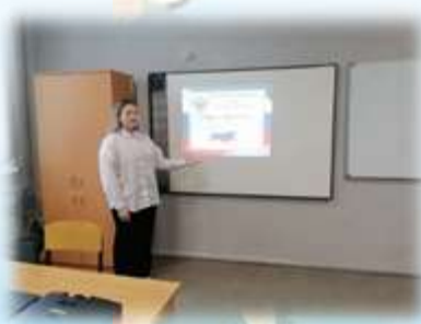
Акция «Русский Крым и Севастополь»