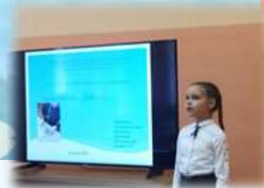
Конкурс проектов «Есть идея -2023»

Независимая газета учащихся МАОУ ДСОШ № 5 «Школьный улей». Выпуск № 174, март, 2023г