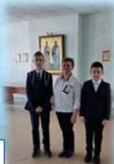
Олимпиада по основам православной культуры