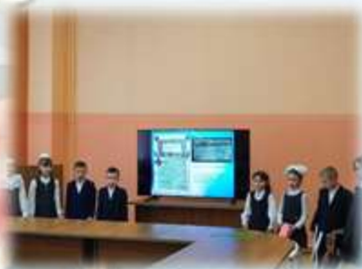
НПК - 2023