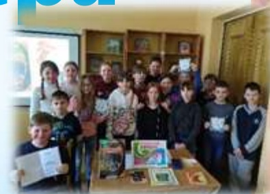
Неделя детской книги