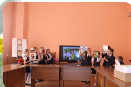
«Волшебная пуговица» 2а класс