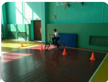
«Безопасное колесо» Сборная команда