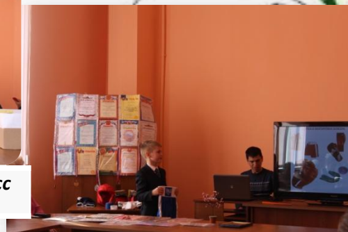
«Бокс- ты жизнь» 2б класс