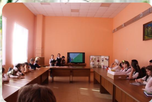
«Куколки - подружки – Лучшие игрушки» 3б класс

Вот уже несколько последних лет такая работа организована и в нашей школе. 26 и 27 марта учащиеся с 1 по 11 класс представляли исследовательские проекты на суд зрителям и жюри. Все представленные работы достойны внимания и хорошей оценки.