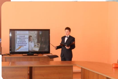
«Герой Советского Союза в нашем семейном альбоме» 6 а класс