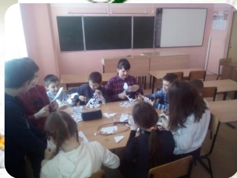
5 б класс