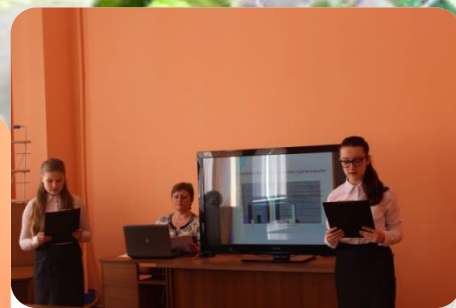
«Шаги финансового успеха» 7а класс

Очень важной представляется организация в школе проектной и исследовательской деятельности учащихся как лучший способ для совмещения современных информационных технологий, личностно-ориентированного обучения и самостоятельной работы учащихся. . Именно работа над проектом позволяет самостоятельно добывать знания, развивать коммуникативные навыки. Проектная деятельность включает не только работу исследовательского характера, но и поиск, обработку данных по теоретической и практической проблеме.