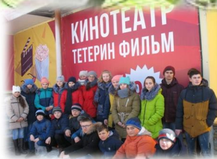
10, 7а, 7б классы

Весенние каникулы успели наступить, Пришла пора про школу позабыть, Резвиться, по ручьям пускать кораблики, Смотреть мультфильмы, кушать пряники. И отдохнуть, да так чтоб нам опять, Порог школы захотеть переступить!