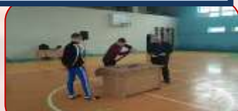
«А, ну-ка, парни!»