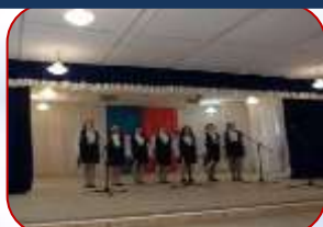
«Пою моё Отечество»