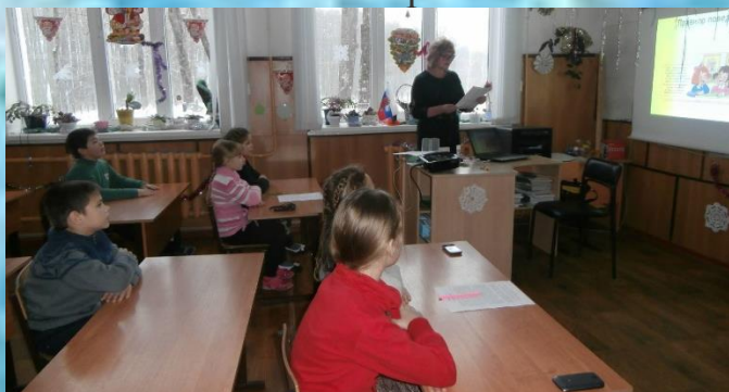
Занятие кружка «Этическая грамматика»