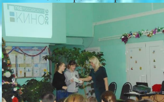
Школьный эфир 2016