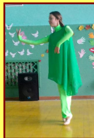
Ученики 11 класса